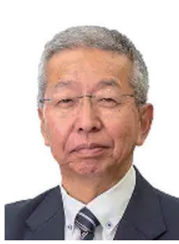
加藤龍幸 石狩市長