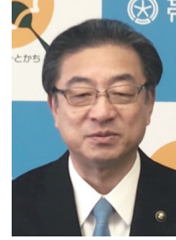
米沢則寿 帯広市長