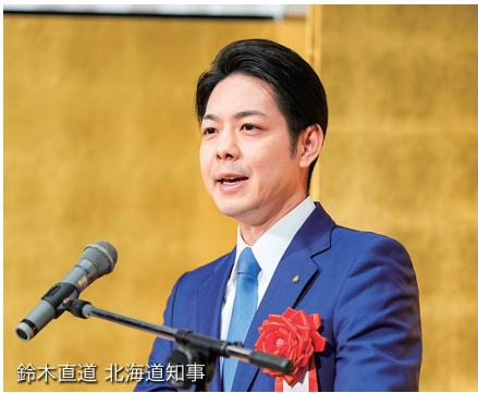
鈴木直道 北海道知事