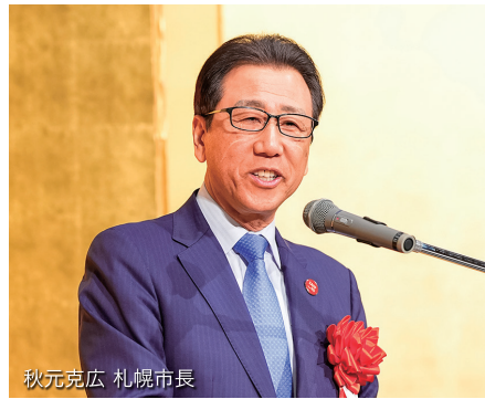
秋元克広 札幌市長