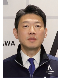
今津寛介 旭川市長