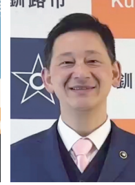
鶴間秀典 釧路市長