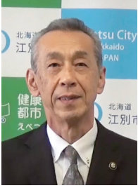
後藤好人 江別市長