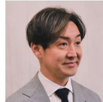
統括 吉住 裕幸 株式会社吉住